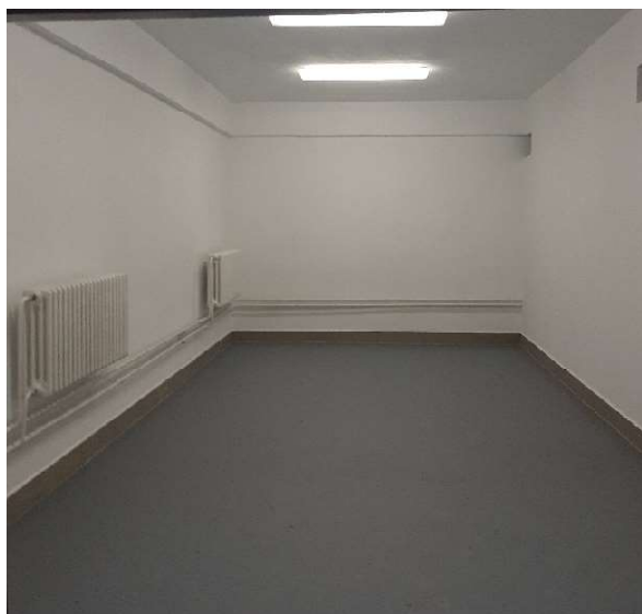
Priestor po realizácii

Účelom dotácie predsedu vlády SR boli stavebné úpravy- oprava havarijného stavu pochôdznej strechy nad suterénom a úprava vnútorných povrchov skladov v HNsP Trstená v hodnote 30 000 € . Priestor sa nachádza v suterénnej časti Hornooravskej nemocnice s Poliklinikou v Trstenej medzi pavilónom administratívnej budovy a kotoľňou. V suteréne slúžia priestory ako sklady - tri skladové priestory na ochranné pomôcky a prevádzkový materiál. Na streche tejto časti je spevnená pochôdzna plocha s parkoviskom a prístupom do práčovne. V miestach styku horizontálnych a vertikálnych konštrukcií dochádzalo po daždi a snežení k výraznému presahu povrchových vôd a následne k zavlhnutiu stien suterénu, čím boli tieto priestory nepoužiteľné. Po odstránení havarijného stavu je objekt opäť plnohodnotne využívaný HNsP Trstená.